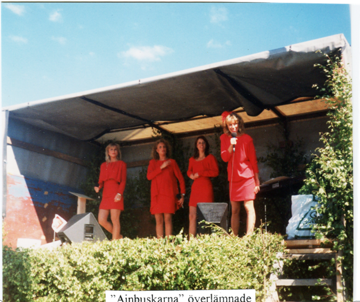
”Ainbuskarna” överlämnade en enbuske som gåva till När Golfklubb

Under premiäråret infördes också speciella onsdagstävlingar med underhållning som även lockade icke golfande ortsbor. En tradition som fortfarande lever här på När. Många kända gotländska artister har uppträtt på klubben genom åren. Självklart Närrevyn men också Ainbusk Singers, Gaston Bros, Brändus Sväinpälsar med flera.